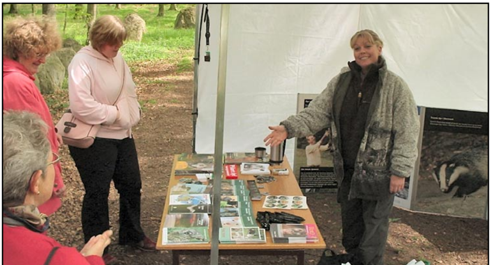
Arkivbilled fra dyrenes dag 2005