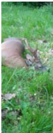
Også Jørgen Lang fik en flot bukke.