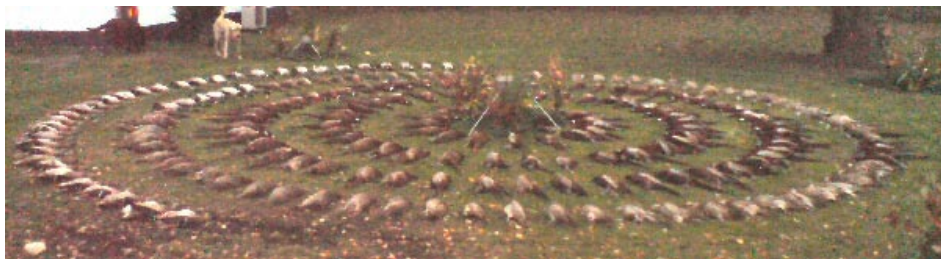
Billedet er fra Rugskov ved Kragerup gods 2009