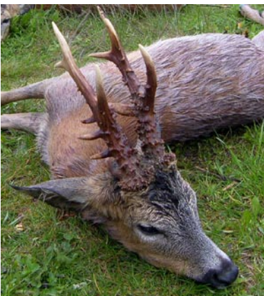
Nærbilled af Kim's buk