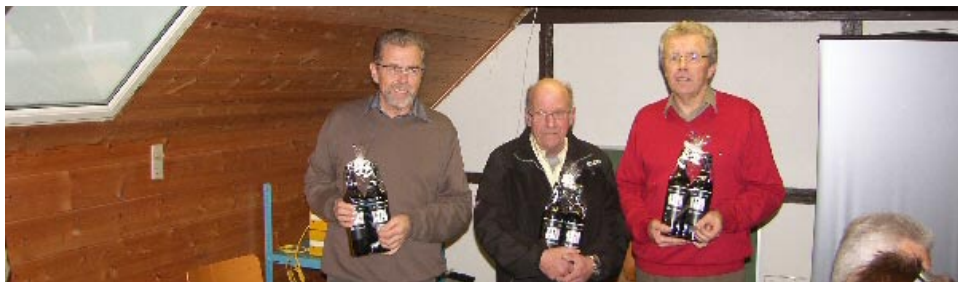
3 af sidste års jubilarer ved generalforsamlingen

Torsdag, den 18. november 2010, kl. 19.00 afholder foreningen ordinær generalforsamling i Revhuset! Du bør møde op! Vi har brug for din mening om, hvad der er godt og skidt, og hvad du synes, kunne gøre foreningen bedre!