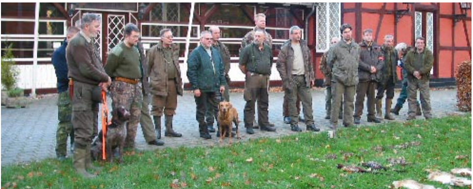
Vildtparade på reguleringsjagten i 2005

Sker det ikke, skal du betale for jagt og forplejning, selv om du ikke deltager.