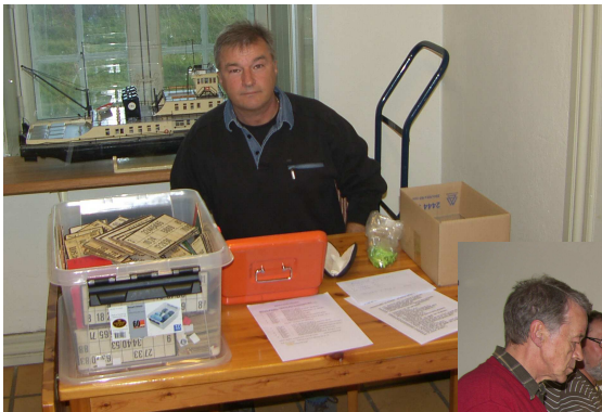
Flemming fra lystfiskerne står klar med biksemad.

Så er Danny klar til at sælge bankokort.